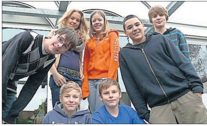
Die Seckenheimer Teilnehmer beim Konfi-Cup.