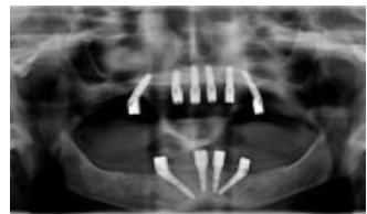
12 Uhr mittags: Speziell anguliert gesetzte Implantate

Eine neue moderne Methode – die sogenannte Sofortfunktion – bei DENTAVITA-Mannheim ist es möglich, einen zahnlosen Kiefer innerhalb von wenigen Stunden mit festen Kronen und Brücken zu versorgen. Bei der Sofortimplantation bleibt dem Patienten die Phase der Ausheilung der Operation nach der Implantation erspart. Die Verkürzung oder Beschleunigung der Einheilzeit kann durch unsere moderne Hightech-Implantat-oberflächen oder durch die Verwendung von Wachstumsfaktoren (BMP) erzielt werden.