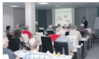
Gerne angenommen werden die Vorträge von Dentavita

die Patientenzufriedenheit und den Patientenkomfort. Längere Zeiträume der Zahnlosigkeit nach der Operation oder der Versorgung mit ästhetisch und funktionell unzufriedenstellenden Provisoren gehören der Vergangenheit an. Diese Methode ist wirtschaftlich, da minimum nur 4 Implantate erforderlich sind, so Dr. Amir-Hoshang.